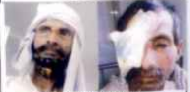
PAS ID PHOTO HERE Poreop Postop